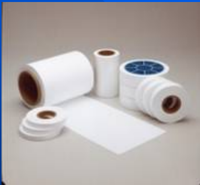
セパレート フィルム